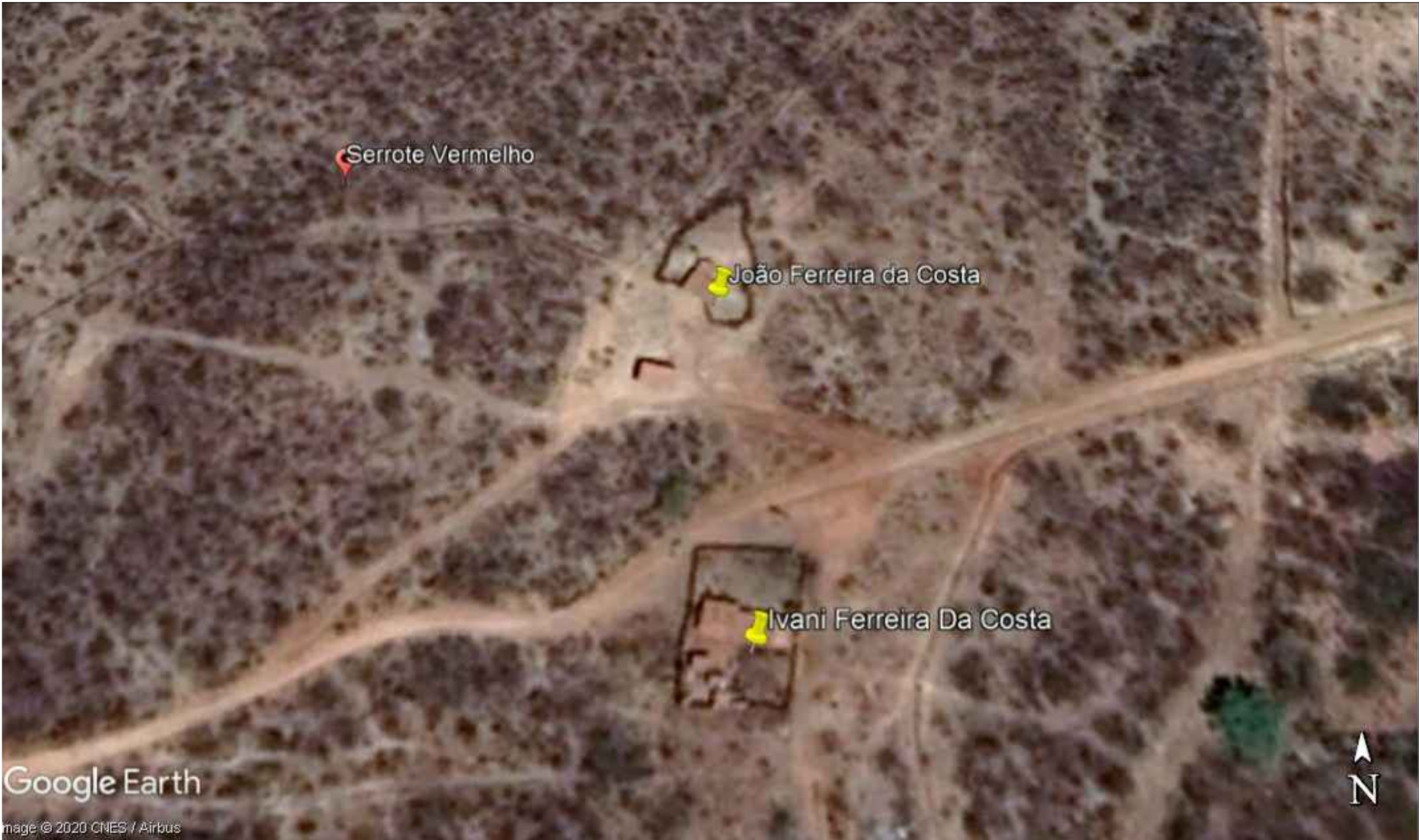
PLANTA DE LOCALIZAÇÃO - SERROTE VERMELHO - ZONA RURAL Melhoria Habitacional para o Contrle da Doença de Chagas - Serra Negra do Norte/RN Escala _____ s/ escala